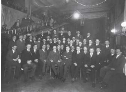
Männerchor Borsdorf um 1900

In Vorbereitung zur Sonderausstellung zu nicht mehr existierenden Chören aus unseren Ortsteilen benötigt der Verein