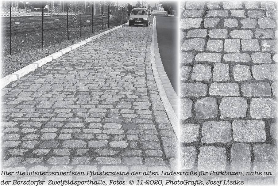
Hier die wiederverwerteten Pflastersteine der alten Ladestraße für Parkboxen, nahe an der Borsdorfer Zweifeldsporthalle, Fotos: © 11-2020, PhotoGrafik, Josef Liedke

bar. Die Behörde zeigte zwar dafür Interesse – leider vergebens. Es wurde bei der Straßen- Sanierung am unteren Viadukt kürzlich entfernt.-