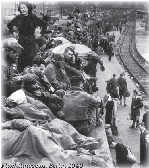
Flüchtlingszug, Berlin 1945

Die Unterbringung erfolgte in leeren Gasthaus-Sälen, Schulen, leeren Baracken und bei Privat-Leuten. Jeder der Ange-