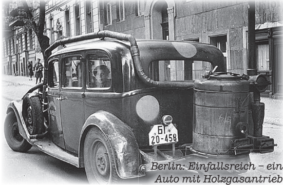
Berlin: Einfallsreich - ein Auto mit Holgasantrieb

Im Juli 1945 begann die Ausweisung der deutschen Bevölkerung aus den nun polnischen oder tschechischen Gebie-