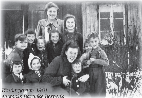
Kindergarten 1951, ehemals Baracke Berneck

Auch die vorhandenen leerstehenden Baracken aus der Kriegszeit wurden als Quartiere genutzt. So z.B. die Baracke des Lagers „Reichsbahn“ in Nähe des ehemaligen Speichers, die „Baracke Berneck“ an der H.-Kretschmann-Straße – ab 1. Mai 1946 Kindergarten - die „Scheinwerfer-Baracke“ in Zweenfurth an der Wolfshainer Straße und das Jugendheim an der Nordstraße. Danach wurden um 1949 die Baracken abgerissen und in der Regel zu Feuerholz umgearbeitet. Ebenso wurden der Saal des „Kaffeebaum“ bis Mitte August 1945 und die Schule bis zum Unterrichtsbeginn am 1. Oktober 1945 als Not-Quartiere genutzt.