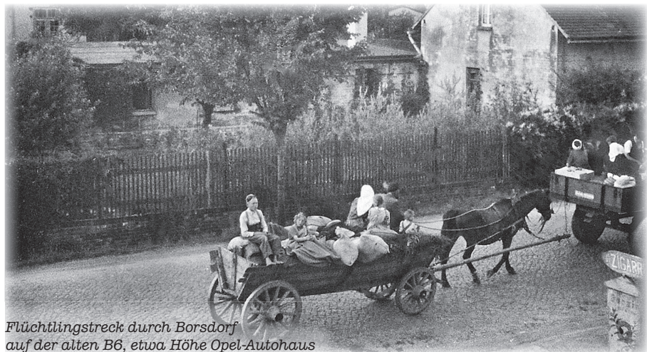
Flüchtlingstreck durch Borsdorf auf der alten B6, etwa Höhe Opel-Autohaus

Die Hilfsbereitschaft war groß, die Ankommenden wurden vom Bürgermeister auf Häuser und Wohnungen verteilt. Eine erhaltene Liste von 1945 gibt Auskunft darüber.